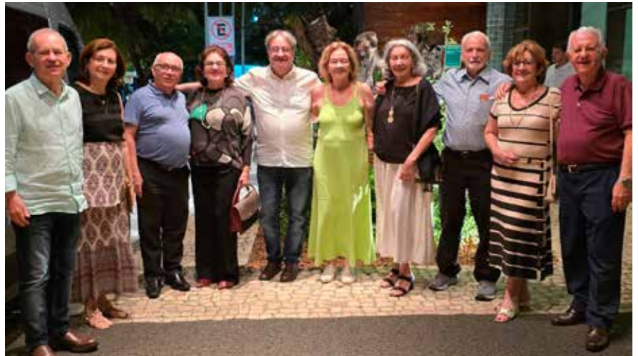
Parte da delegação sergipana na I Alagipe.